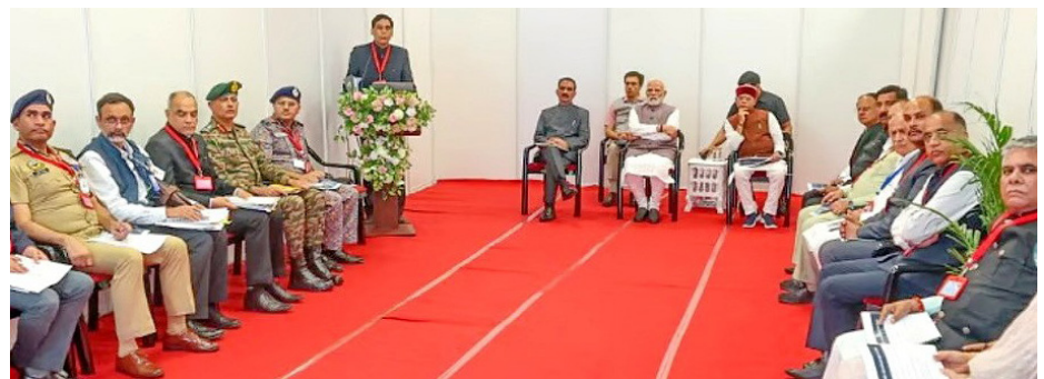
▲ चित्र 5.3 : माननीय प्रधानमंत्री श्री नरेंद्र मोदी उच्चस्तरीय समीक्षा बैठक की अध्यक्षता करते हुए